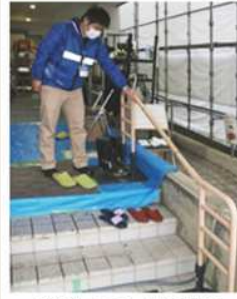
階段の手すり設置