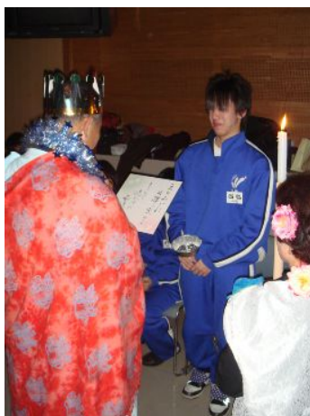
贈る言葉を書いた色紙をプレゼント