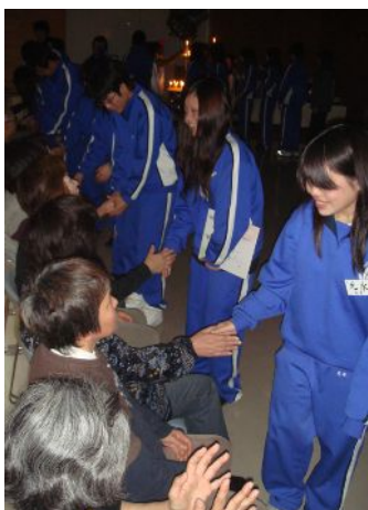
お別れのあいさつ

や生徒の皆さんの気持ちが一つになったからだと思います。市役所通り区のサロンを通して、サロンは高齢者が参加して楽しめるばいというのではなく、その世話人や参加者の地域の生活や活動に影響があるものと実感しています。これからもこのようなサロンを市内に普及していきたいと思えます。」と話してくれました。