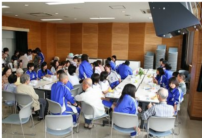
サロン参加者と高校生の茶話会

続いて、お茶飲みの時間です。サロン参加者と生徒は、最初はよそよそしい雰囲気でしたが、次第に打ち解け、会話に笑い声が生まれていました。ある生徒は、「おばあちゃんが県外で一人暮らししています。普段、高齢者の方と話す機会が少ないので、とてもいい経験になります。」と話していました。