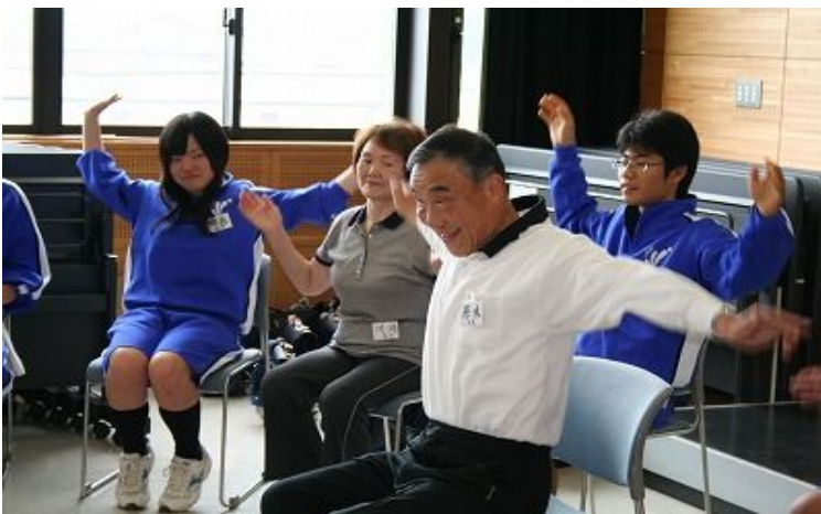
原本さんによるレクリエーション

ことは大変なことですよ。笑顔で楽しくやりましょう。笑うことで健康になるんですよ。腹を抱えて笑ってください。」と楽しみながらレクリエーションや健康体操を行うことの大切さについて話します。