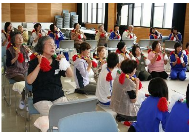
全員で銭太鼓演奏

戸時代の通貨の寛永通宝が入っており、「春の小川」に合わせ、全員が心をひとつにして、銭太鼓を演奏しました。